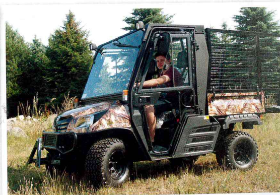
Univerzální terénní vozidlo Mechron v kamuflážním zbarvení s pletivovou nástavbou