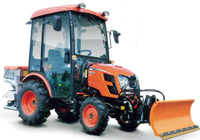
Zimní set na stroji Kioti CK 2810