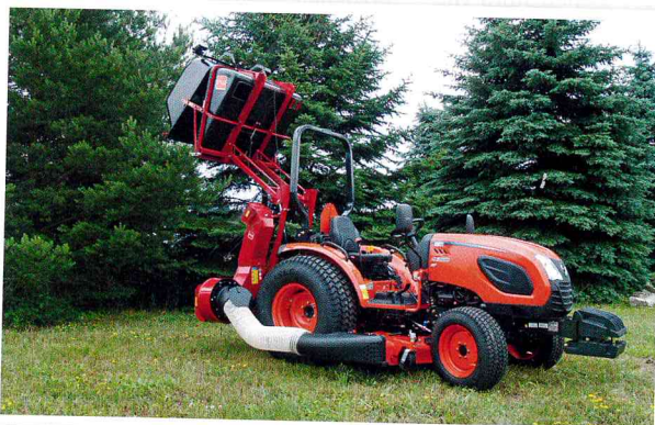
Kioti CK 3510 H s mezinápravovým sečením Zappator 150 a vysavačem Morgnieux s objemem zásobníku 790 l

Pro náročnější uživatele, kteří potřebují silnější, ale přitom úzký traktor do 140 cm, jsou k dispozici ještě dva modely, a to CK 3510 H a CK 4010 H (35/40 k). Ty už zvládnou i třítunový