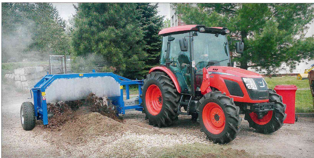
Kioti RX 7330 PC s překopávačem kompostu EuroBagging

nosiče kontejnerů. V široké nabídce traktorů si můžete vybrat z modelových řad DK (45 až 55 k), NX (45–60 k), RX (60–73 k) a nejsilnější PX (90–110 k).