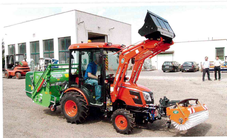
Traktor Kioti CK 2810 H s čelním nakladačem, kartáčem Tuchel a mulčovačem se sběrem Koala

Pro zimní údržbu se dodávají traktory výhradně v agregaci s vyhřívanou kabinou, čelními hydraulickými rameny