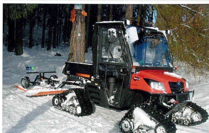
UTV Kioti Mechron s pásovým podvozkem a „stopařem“