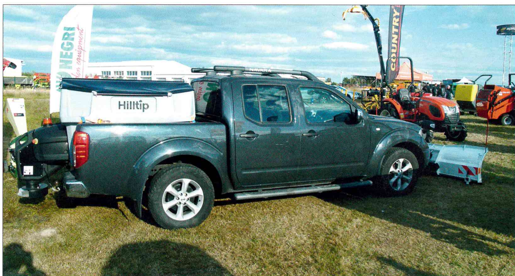
Pick-up Nissan Navara v agregaci s radlicí a rozmetadlem Hilltip