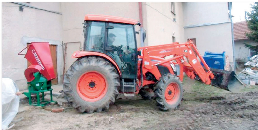
Stroj je pohonnou jednotkou i pro štěpkovač větví a dřeva Bystroň Pirba