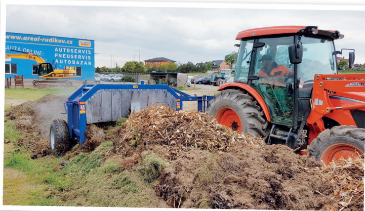
Traktor v agregaci s překopávačem Euro Bagging NP 2.0

Technickou četou zajišťující komunální služby tvoří v Rudíkově dva stálí zaměstnanci obecního úřadu, ke kterým v případě potřeby přibývají brigádníci. Starají se o obecní zeleň, v zimních měsících o úklid komunikací a zabezpečují i další práce. „Uvažovali jsme