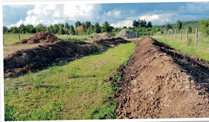
Kompostárna Rudíkov má roční provozní kapacitu do 150 tun