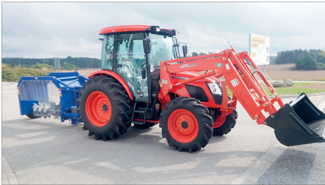
Traktor je vybaven čelním nakladačem Kioti KL 7320

o využití dotačního titulu na snížení prašnosti a koupi zametacího speciálu. Nicméně jsme nakonec dospěli k názoru, že se bez něj obejdeme a jarní úklid raději řešíme externě. Nicméně dotaci jinak využíváme. Zateplili jsme například dvě obecní budovy, čeká nás vybudování čistítky odpadních vod a rádi bychom v případě 90 domácností spustili v příštím roce projekt třídění odpadu u paty domu a občanům poskytli potřebné barevné sběrné nádoby," vysvětluje Zdeněk Souček.