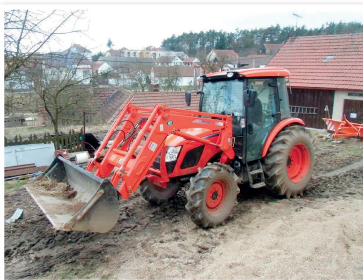
Od loňského září pracuje v Rudíkově traktor Kioti RX7320

Kompost se zpracovává technologií zakládky do pásových hromad do velikosti deseti tun a letos, především vzhledem k letnímu suchu, byla kapacita kompostárny využita zhruba z poloviny. Vzniklý produkt si mohou odbírat občané na svoje zahrádky a obec jej chce nabídnout i zemědělcům.