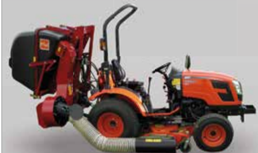
Traktor KIOTI CK2810 HST Mezinápravové sečení ZAPPATOR JET150 Vysavač trávy Morgnieux 790HD

Více informací žádejte na telefonních číslech: