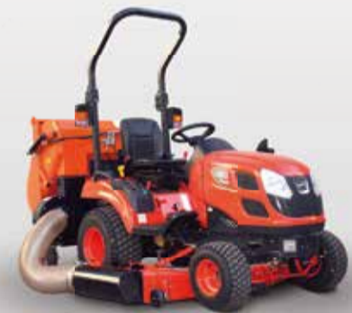
Traktor KIOTI CS 2610 Mezinápravové sečení Zappator JET 150