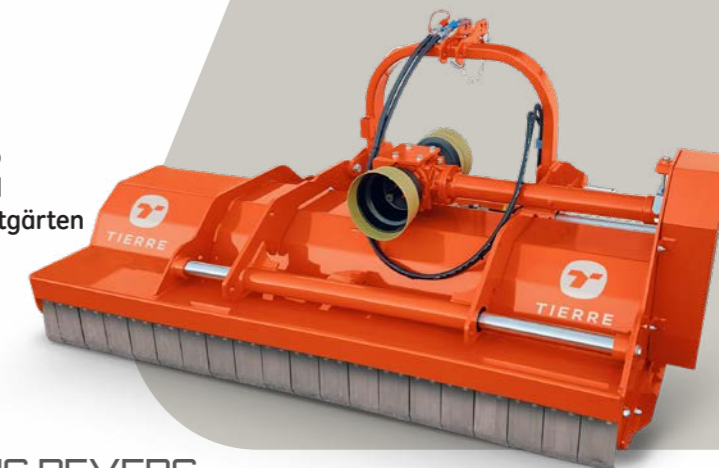
TIGRA PLUS REVERS

Rotore Multiaggressivo per frutteto Multi-aggressive rotor for orchard Multiaggressive Rotorwelle für Obstgärten Rotor multi agressif pour vergers Rotor multiagresivo para frutales