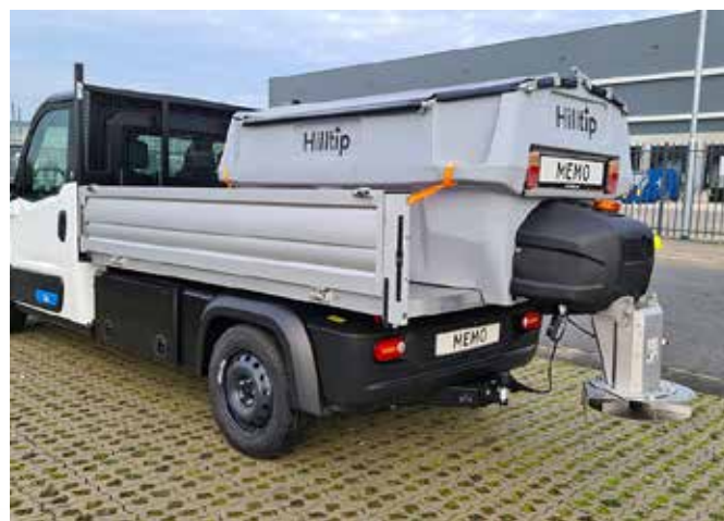
Rozmetadlo 850 I na Goupilu G6