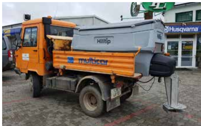
Rozmetadlo 1100 I na Multicar