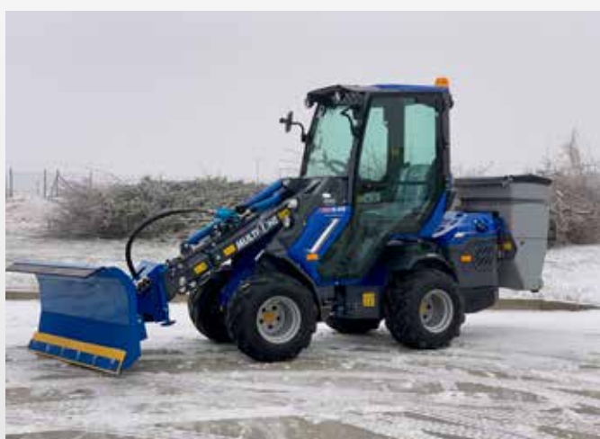
Rozmetadlo 200 l na nakladači Multione