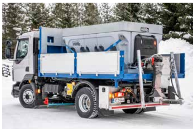
Rozmetadlo 4000AM na MANu

Možnost tahat rozmetadlo za autem. Konstrukce zásobníku s dvojitými stěnami obsahuje integrovanou nádrž pro přestavbu vašeho rozmetadla s možností aplikace zvlhčené soli a dovybavení na postřik solankou.