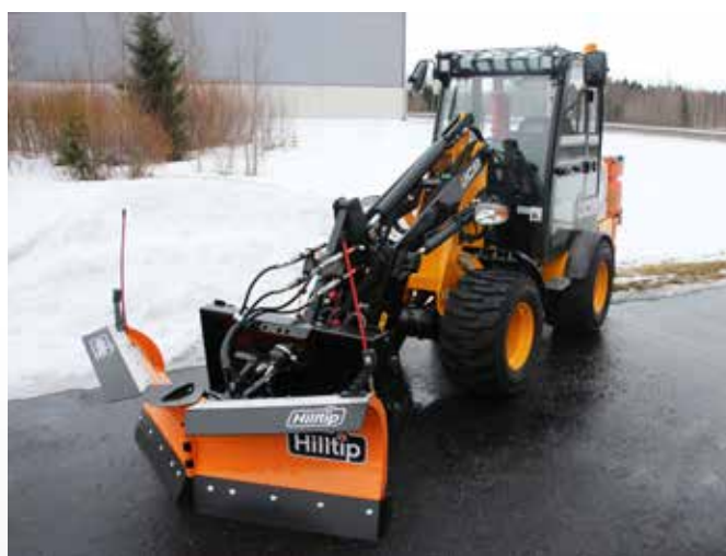
Radlice 2400VP na nakladači JCB