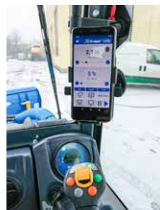
Ovládání radlice a rozmetadla