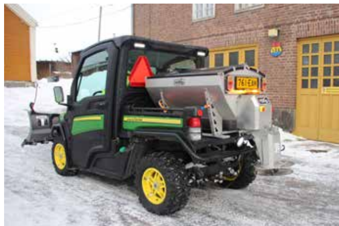
Rozmetadlo 380 I na John Deere Gator