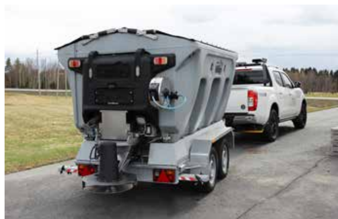
Tažené rozmetadlo 1600 l za autem