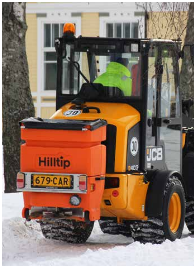
Rozmetadlo 200 I na nakladači