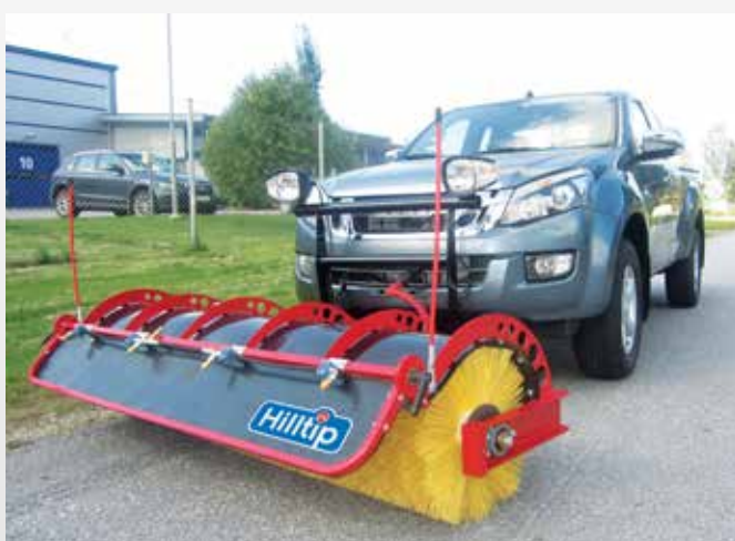
Zametačí kartáč na Isuzu D-max