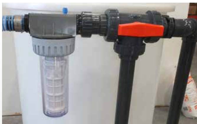
Robustní filtr a třicestný ventil