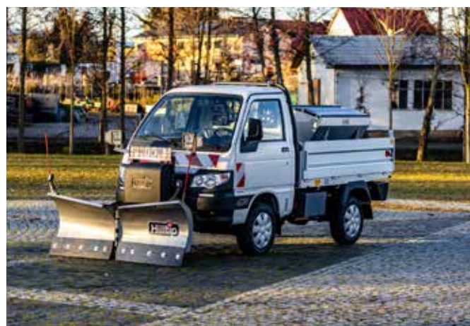
Radlice 1650VP a rozmetadlo 380 l na Piaggio