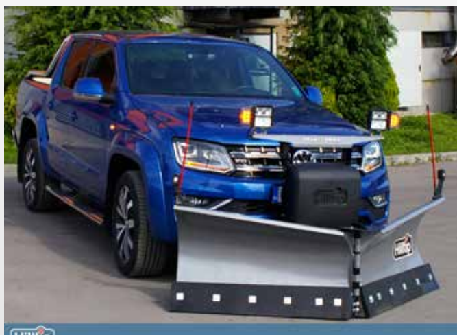
Radlice 2100VP na Volkswagenu Amarok