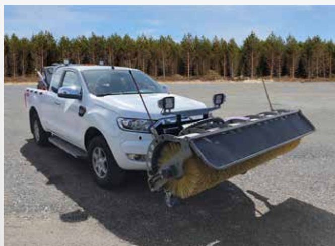
Kartáč na Fordu Ranger