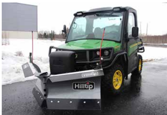
Radlice 1850VUTV na John Deeru Gator