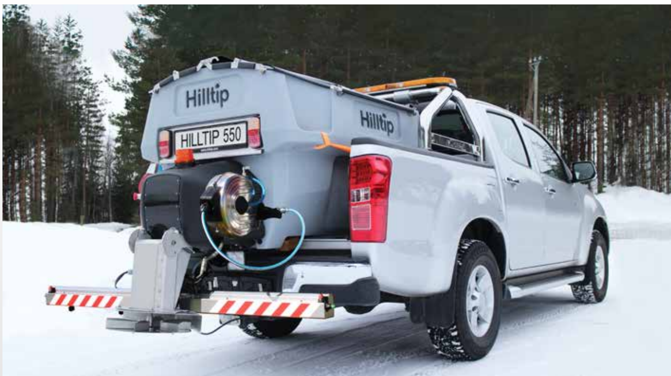
Rozmetadlo 550 I v plné výbavě s předvlhčovacím systémem, bubnem s 12m hadicí a postřikovací lištou