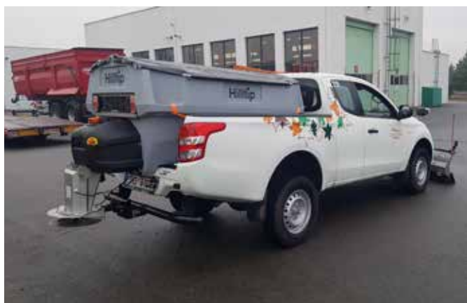
Rozmetadlo 850 l a radlice 2250SP na Mitsubishi L200