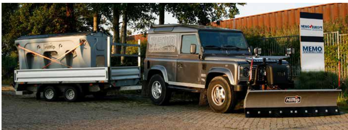
Radlice 2400SP a tažené rozmetadlo 1600 l s Land Roverem Defender