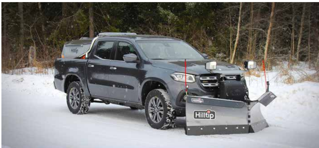
Radlice 2250VP na Mercedesu X