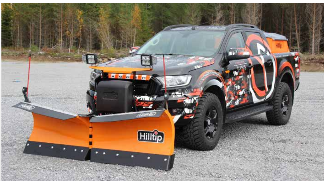
Radlice 2250VP a rozmetadlo 550 l na Fordu Ranger