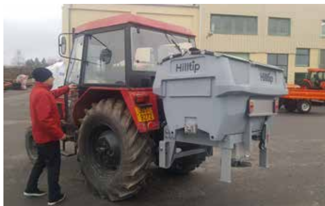
Rozmetadlo 600TR na traktoru Zetor