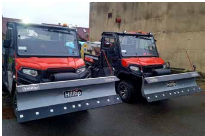
Radlice 1850SUTV, rozmetadlo 380l na Kioti K9