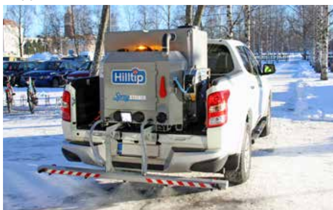
Aplikátor solanky na pickupu