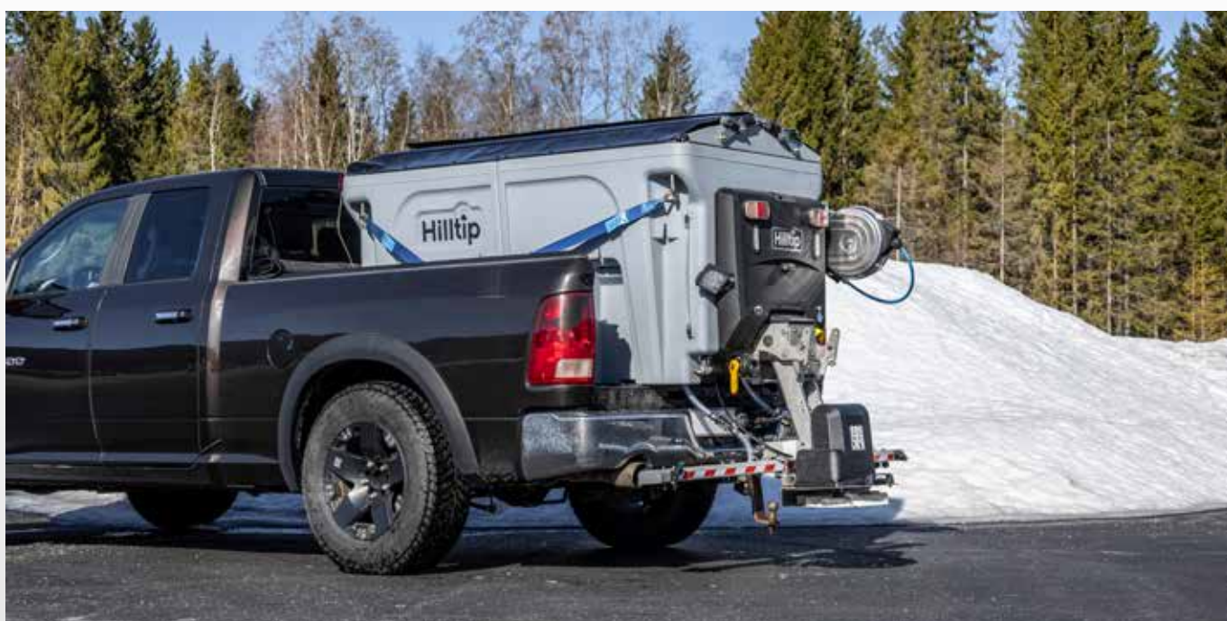
Rozmetadlo 900AM na Fordu F-150