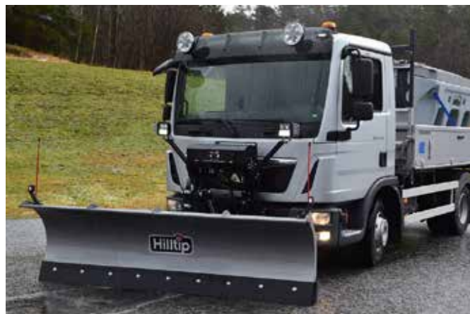
Radlice 2750SML a rozmetadlo 2100 l na MANu