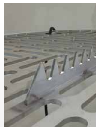
Hřeben na řezání sáčků