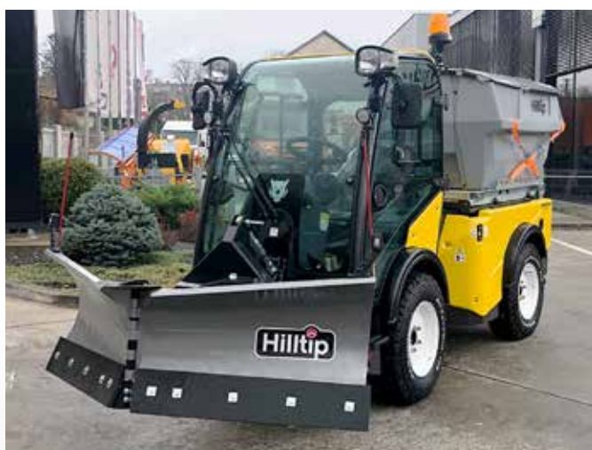
Radlice 1650VP a rozmetadlo 550 l na nosiči