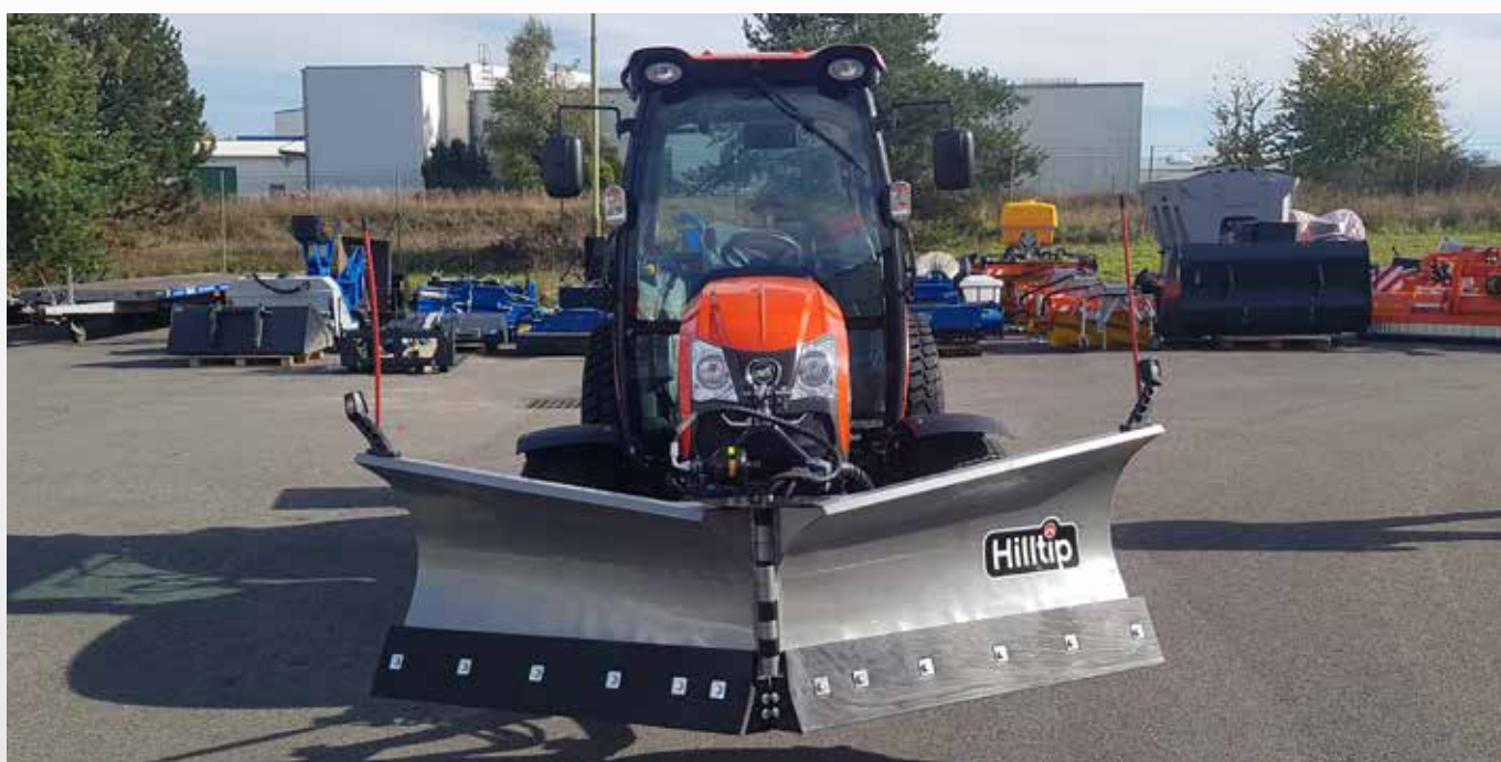
Radlice VTR2400 s traktorem Kioti DK6010CH