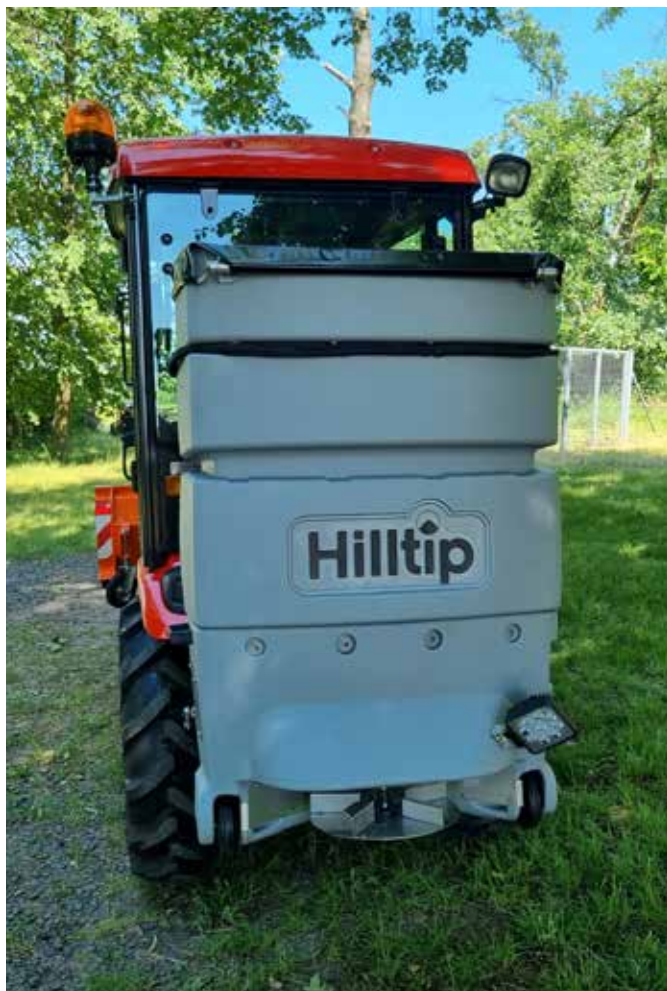
Rozmetadlo 300 I s traktorem Kioti