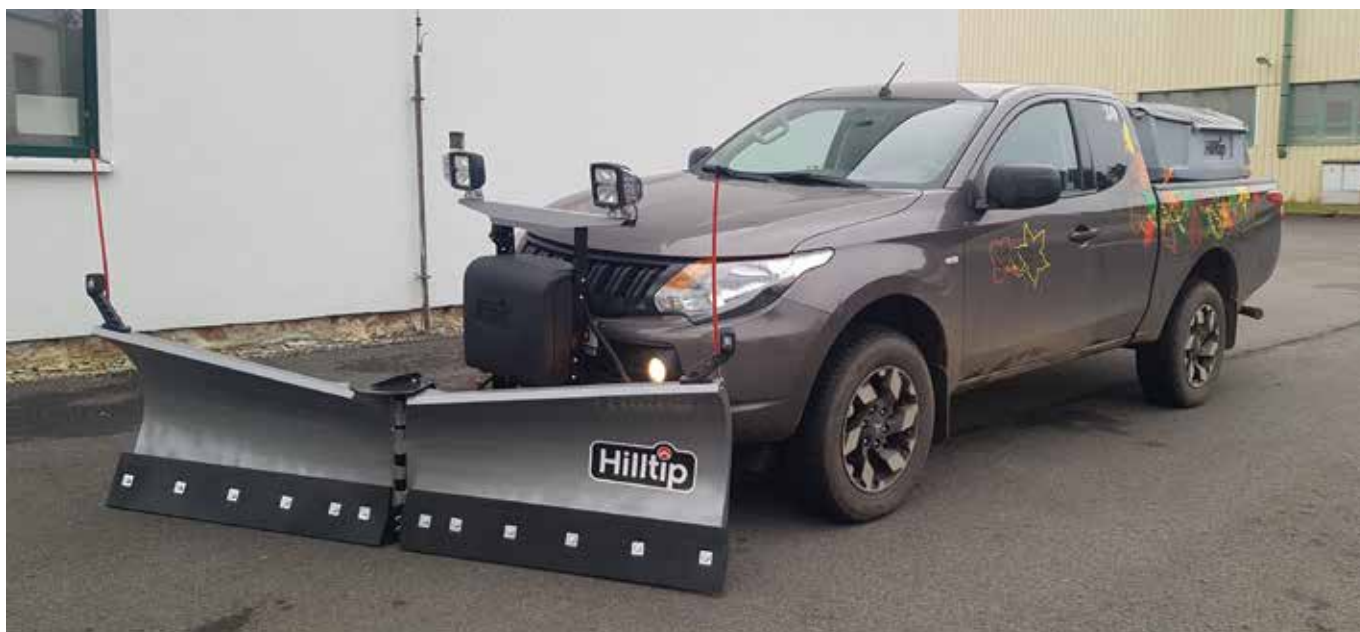
Radlice 2250VP a rozmetalo 550 l na Mitsubishi L200